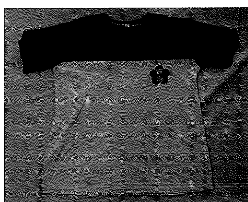
西港字樣的短袖運動服(紅色)