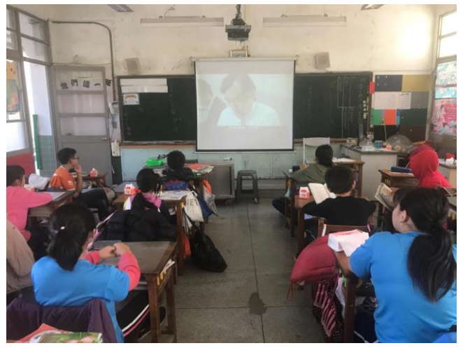
▲圖 2 欣賞音樂-稻香(周杰倫)