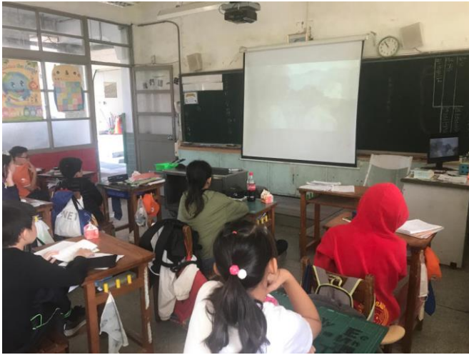
▲圖 1 欣賞音樂-《太陽的孩子》電影主題曲 - 不要放棄 Aka Pisawad