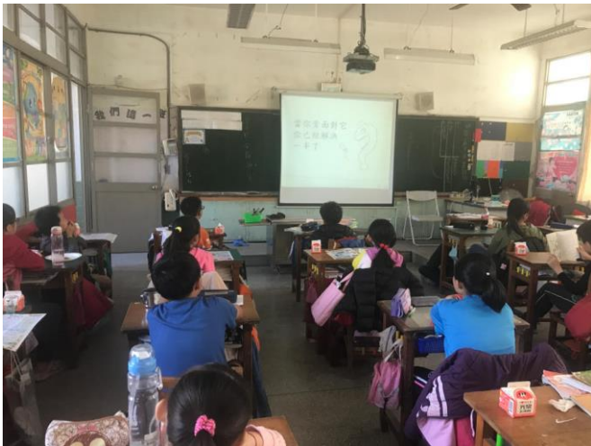
▲圖 3 觀賞影片-學校沒有教你的五件事