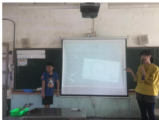
▲圖 6【生命小學堂】上課情形