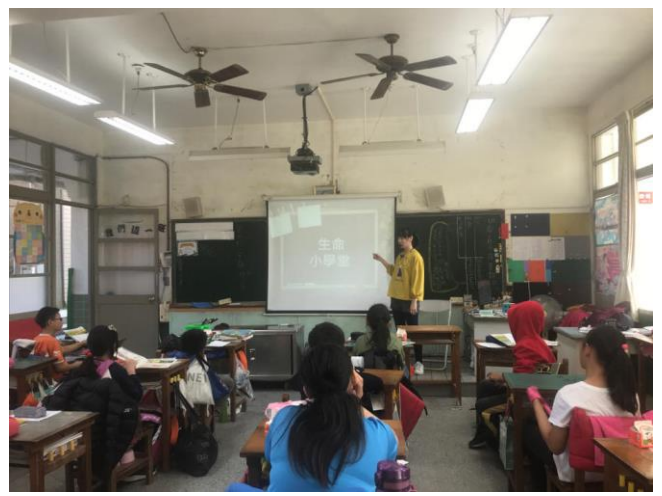
▲圖 4 【生命小學堂】上課情形